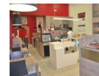
Alsace Lorraine Grenoble