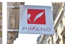
Pierre Sémard - Europe Grenoble