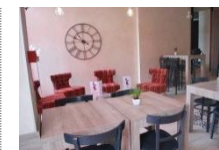
Avenue de Verdun Meylan